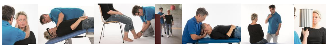
Daniel Bühler, Gockhausen, Schweiz, aus Schädler, Gleichgewicht und Schwindel © Elsevier GmbH, Urban & Fischer, München